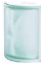
VERDE ANG O SAT SAP CODE: 112543