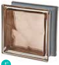
TORTORA Q19 O MET SAP CODE: 120836