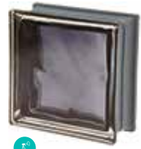
ARDESIA Q19 O MET SAP CODE: 120820