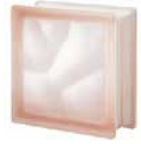
ROSA Q19 O SAHARA 2S SAP CODE: 124052