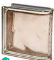
TORTORA TER LINEARE O MET SAP CODE: 120838