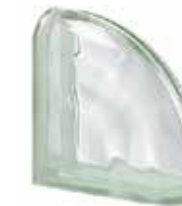
VERDE TER CURVO O SAP CODE: 123942