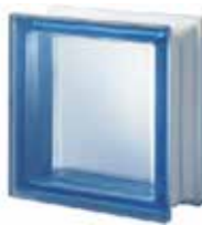
BLU Q19 T SAT 1 LATO SAP CODE: 115099