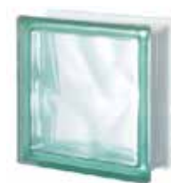
VERDE Q19 O SAHARA 1S SAP CODE: 123761