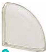
BIANCO TER CURVO O MET SAP CODE: 120813