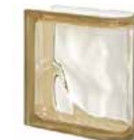
SIENA TER LINEARE O SAP CODE: 123551