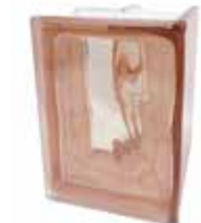
ROSA Q19 O CORNER 90* SAP CODE: 123922