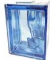
BLU Q19 O CORNER 90° SAP CODE: 123923