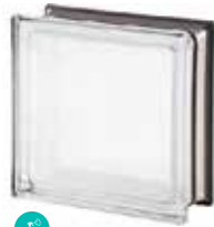
WHITE 30% Q19 T MET SAP CODE: 113041