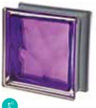
INDACO Q19 O MET SAP CODE: 120824