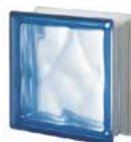
BLU Q19 O SAHARA 1S SAP CODE: 124136