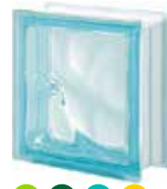
ACQUAMARINA Q19 0 SAP CODE: 123476