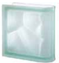
VERDE TER LINEARE O SAHARA 2S SAP CODE: 113026