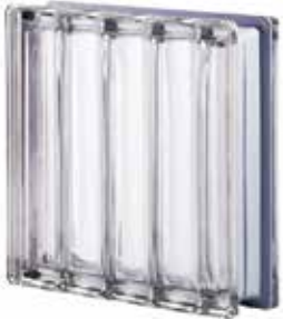
NEUTRO Q30 DORIC MET SAP CODE: 123017