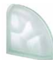
VERDE TER CURVO O SAHARA 2S SAP CODE: 106074