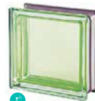
MALACHITE Q19 T MET SAP CODE: 113036