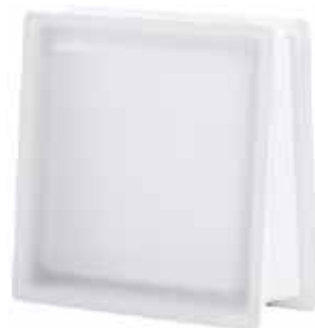
NEUTRO Q30 TRAPEZOIDAL T SAHARA 2S* SAP CODE: 124102