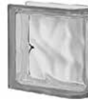
NORDICA TER LINEARE O SAP CODE: 115997