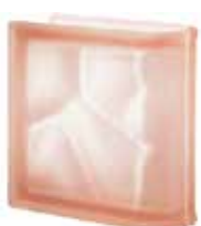
ROSA TER LINEARE O SAHARA 2S SAP CODE: 112511