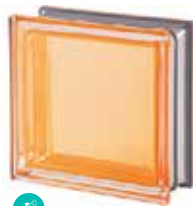
AMBRA Q19 T MET SAP CODE: 113028