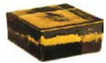
SIENA VETROPIENO QUADRATO SAP CODE: 124198