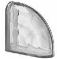
NORDICA TER CURVO O SAP CODE: 122745