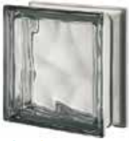
NORDICA Q19 O MET SAP CODE: 115358