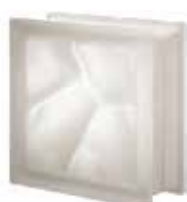
NEUTRO Q19 O SAT SAP CODE: 119962