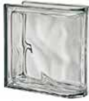
NORDICA TER LINEARE O MET SAP CODE: 121608