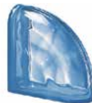
BLU TER CURVO O SAP CODE: 122744