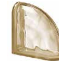
SIENA TER CURVO O SAP CODE: 123835