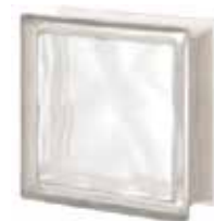
NEUTRO Q19 O SAT 1 LATO SAP CODE: 119963