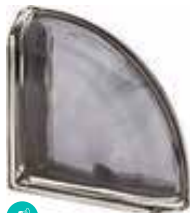
ARDESIA TER CURVO O MET SAP CODE: 120821