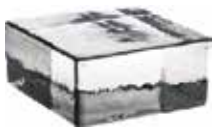
NEUTRO VETROPIENO QUADRATO SAP CODE: 123863