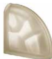
SIENA TER CURVO O SAHARA 2S SAP CODE: 124094