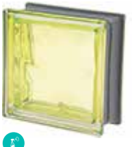
KIWI Q19 O MET SAP CODE: 120851