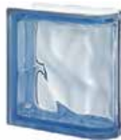
BLU TER LINEARE O SAP CODE: 123623