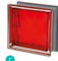
SCARLATTO Q19 O MET SAP CODE: 120840

*Verify the availability. / Vérifiez la disponibilité. / Verfügbarkeit und minimale Produktionsmenge. / Verificar la disponibilidad.