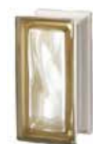
SIENA R09 O SAT 1 LATO SAP CODE: 123572