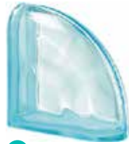
ACQUAMARINA TER CURVO 0 SAP CODE: 122742