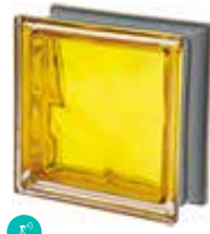
ORO Q19 O MET SAP CODE: 120849