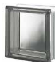
NORDICA Q19 T SAP CODE: 121380