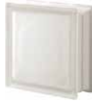
NEUTRO Q19 T SAHARA 2S SAP CODE: 123971