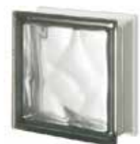
NORDICA Q19 O SAT 1 LATO SAP CODE: 120943