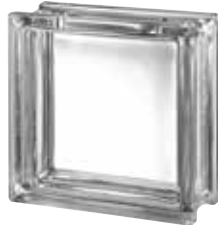
CLEAR 1919/8 CLEARVIEW CRAFTBLOCK SAP CODE: 122684