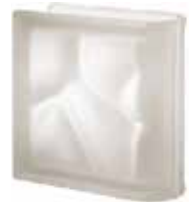
NEUTRO TER LINEARE O SAT SAP CODE: 120105