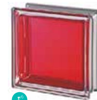
RUBINO Q19 T MET SAP CODE: 113037