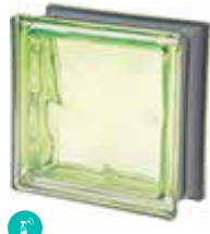
MUSCHIO Q19 O MET SAP CODE: 120845