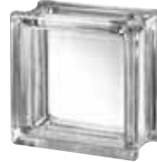
CLEAR 663 CLARITY CRAFTBLOCK SAP CODE: 123553