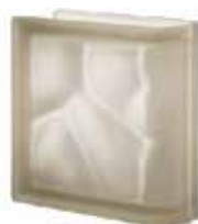
SIENA TER LINEARE O SAT SAP CODE: 122755