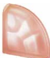
ROSA TER CURVO O SAHARA 2S SAP CODE: 124156