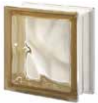
SIENA Q19 O SAP CODE: 122078