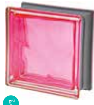
MAGENTA Q19 O MET SAP CODE: 120846