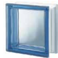
BLU Q19 T SAP CODE: 122075