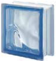
BLU Q19 O SAP CODE: 122074