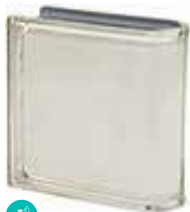
BIANCO TER LINEARE O MET SAP CODE: 120814