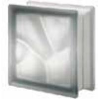
NORDICA Q19 O SAT SAP CODE: 120942