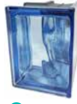
BLU Q19 O MET CORNER 90 SAP CODE: 123799