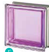
TORMALINA Q19 T MET SAP CODE: 113039