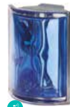
COBALTO ANG O MET SAP CODE: 120831