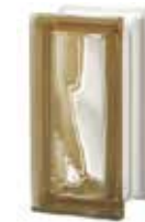
SIENA R09 O SAP CODE: 123733