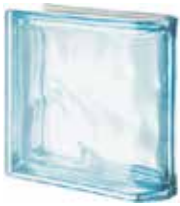
ACQUAMARINA TER LINEARE 0 MET SAP CODE: 123731