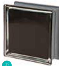
NERO Q19 O MET SAP CODE: 120816