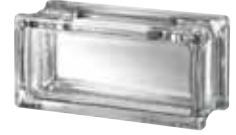
CLEAR 483 CLARITY CRAFTBLOCK SAP CODE: 123552