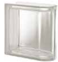
NEUTRO TER LINEARE T SAP CODE: 119902