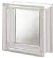
NEUTRO Q19 T SAP CODE: 119822