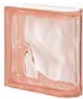
ROSA TER LINEARE O SAP CODE: 123700