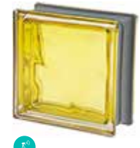
CEDRO Q19 O MET SAP CODE: 120832