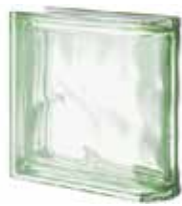
VERDE TER LINEARE O MET SAP CODE: 123793