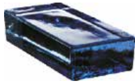
BLU VETROPIENO RETTANGOLARE SAP CODE: 704170