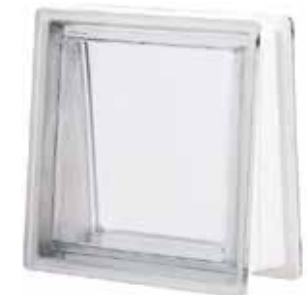
NEUTRO Q30 TRAPEZOIDAL T SAP CODE: 111889

* Sahara 1 side (sandblasted) available on demand. / Sahara 1 face (sablée) disponible sur demande. / Sahara 1 Seite (sandgestrahlt) auf Anfrage erhältlich. / Sahara 1 lado (satinado a la arena) disponible bajo pedido.