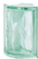
VERDE ANG O SAP CODE: 112542