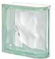
VERDE TER LINEARE O SAP CODE: 123833