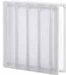
NEUTRO Q30 DORIC SAHARA 2S SAP CODE: 122392