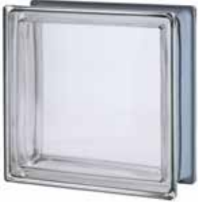
NEUTRO Q33 T MET SAP CODE: 116526

Availability to be verified before the order. / Vérifiez la disponibilité avant de confirmer la commande. / Verfügbarkeit ist vor Bestellung zur prüfen. / Verificar la disponibilidad antes de confirmar el pedido.