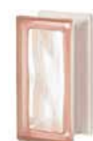
ROSA R09 O SAHARA 1S SAP CODE: 123730