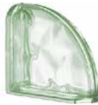
VERDE TER CURVO O MET SAP CODE: 123795