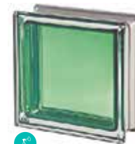
GIADA Q19 T MET SAP CODE: 113035