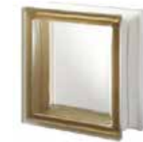
SIENA Q19 T SAHARA 1S SAP CODE: 122601