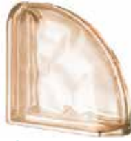
ROSA TER CURVO O MET SAP CODE: 123796