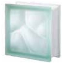
VERDE Q19 O SAT SAP CODE: 123061