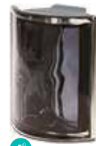
ARDESIA ANG O MET SAP CODE: 120823