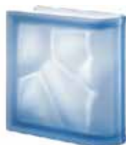
BLU TER LINEARE O SAT SAP CODE: 106076