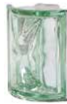
VERDE ANG O MET SAP CODE: 123642