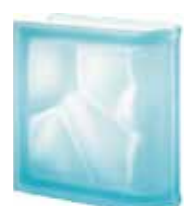
ACQUAMARINA TER LINEARE 0 SAHARA 2S SAP CODE: 123875