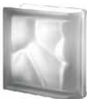
NORDICA TER LINEARE O SAT SAP CODE: 122771