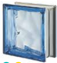
BLU Q19 O MET SAP CODE: 122422