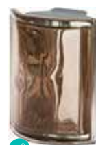
TORTORA ANG O MET SAP CODE: 120839

*Verify the availability. / Vérifiez la disponibilité. / Verfügbarkeit und minimale Produktionsmenge. / Verificar la disponibilidad.