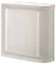
NEUTRO TER LINEARE T SAHARA 2S SAP CODE: 123943