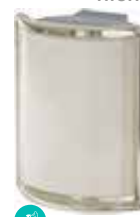
BIANCO ANG O MET SAP CODE: 120815