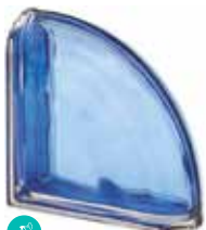
COBALTO TER CURVO O MET SAP CODE: 120829