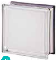
WHITE 100% Q19 T MET SAP CODE: 113040