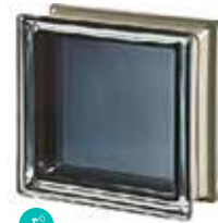
BLACK 30% Q19 T MET SAP CODE: 113032