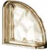
SIENA TER CURVO O MET SAP CODE: 123797