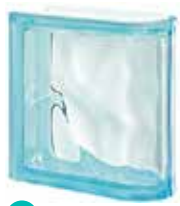
ACQUAMARINA TER LINEARE 0 SAP CODE: 123699