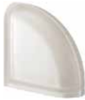
NEUTRO TER CURVO T SAT SAP CODE: 120249