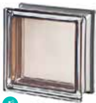
AGATA Q19 T MET SAP CODE: 113027