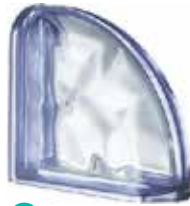
BLU TER CURVO O MET SAP CODE: 108650