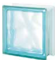
ACQUAMARINA Q19 0 SAHARA 1S SAP CODE: 124048