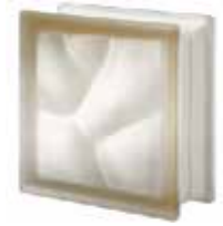
SIENA Q19 O SAHARA 2S SAP CODE: 123584