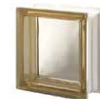
SIENA Q19 T SAP CODE: 123052