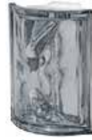
NORDICA ANG O MET SAP CODE: 121607