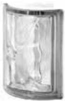
NORDICA ANG O SAP CODE: 116039