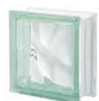
VERDE Q19 O SAP CODE: 123831