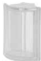
NEUTRO ANG T SAP CODE: 120430