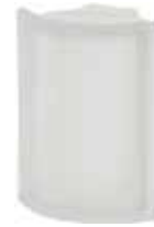
NEUTRO ANG T SAT SAP CODE: 120464