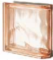
ROSA TER LINEARE O MET SAP CODE: 123781