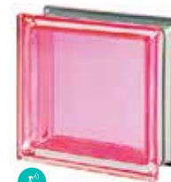
CORALLO Q19 T MET SAP CODE: 113034