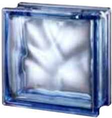
BLUE 1919/8 WAVE CRAFTBLOCK SAP CODE: 121802