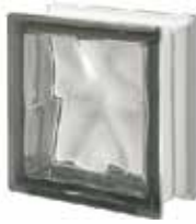
NORDICA Q19 O SAP CODE: 120762