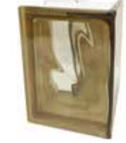
SIENA Q19 O CORNER 90* SAP CODE: 123926