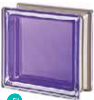
AMETISTA Q19 T MET SAP CODE: 113029