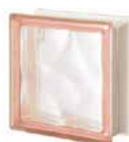
ROSA Q19 O SAHARA 1S SAP CODE: 124053