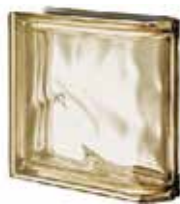
SIENA TER LINEARE O MET SAP CODE: 123021