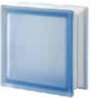
BLU Q19 T SAT SAP CODE: 113391