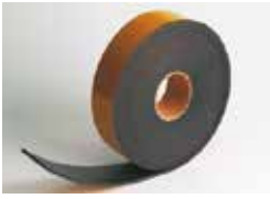
Expansion joint D'expansion joint Dehnungsfuge Junta de dilatación