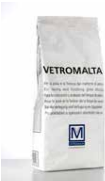
Glass mortar "Vetromalta" White or grey premixed mortar / Vetromalta Il s'agit d'un liant prémélangé de couleur blanche ou grise / Vetromalta Vorgemischter Mörtel in den Farben Weiß oder Grau / Vetromalta Es un mortero premezclado de color blanco o gris