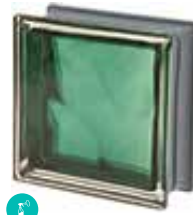
SMERALDO Q19 O MET SAP CODE: 120848