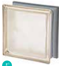
AVORIO Q19 O MET SAP CODE: 120844