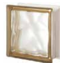
SIENA Q19 O SAT 1 LATO SAP CODE: 121621