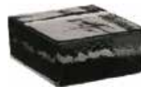
NORDICA VETROPIENO QUADRATO SAP CODE: 121283