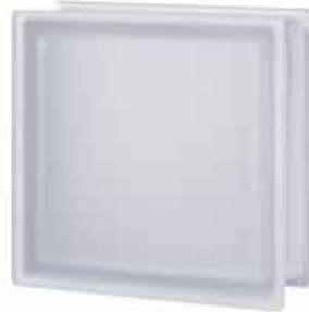
NEUTRO Q33 T SAHARA 2S* SAP CODE: 123612