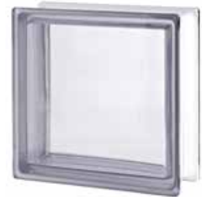
NEUTRO Q33 T SAP CODE: 115360