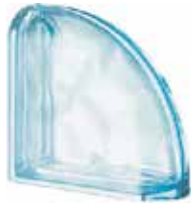
ACQUAMARINA TER CURVO 0 MET SAP CODE: 123732