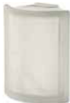
NEUTRO ANG O SAT SAP CODE: 120463