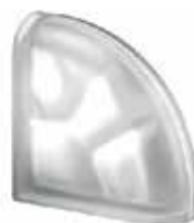
NORDICA TER CURVO O SAHARA 2S SAP CODE: 123876