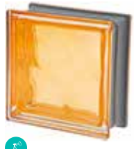
OCRA Q19 O MET SAP CODE: 120850