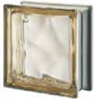
SIENA Q19 O MET SAP CODE: 121342