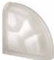
NEUTRO TER CURVO O SAT SAP CODE: 120248