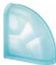
ACQUAMARINA TER CURVO 0 SAT SAP CODE: 106070