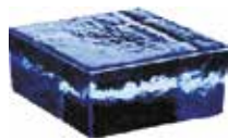
BLU VETROPIENO QUADRATO SAP CODE: 123125