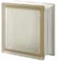
SIENA Q19 T SAHARA 2S SAP CODE: 121668