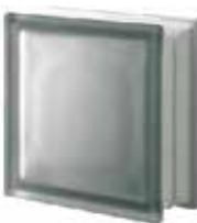
NORDICA Q19 T SAT SAP CODE: 121194