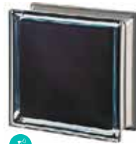
BLACK 100% Q19 T MET SAP CODE: 113031