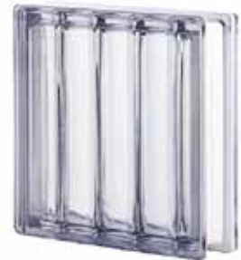
NEUTRO Q30 DORIC SAP CODE: 122141