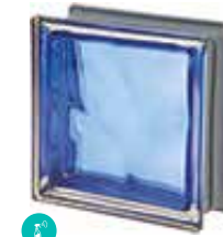
COBALTO Q19 O MET SAP CODE: 120828