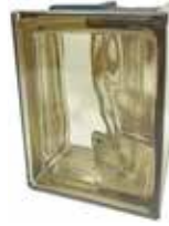
SIENA Q19 O MET CORNER 90 SAP CODE: 123802