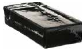
NORDICA VETROPIENO RETTANGOLARE SAP CODE: 703702