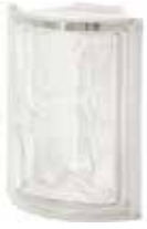
NEUTRO ANG O SAP CODE: 120429