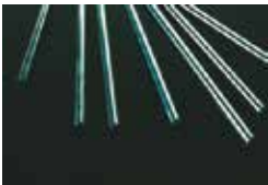
AISI 430 Stainless Steel Rods Barres en acier inoxydable AISI 430 Rundstahl Edelstahl AISI 430 Varillas de acero inoxidable AISI 430