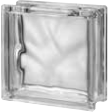
CLEAR 1919/8 WAVE CRAFTBLOCK SAP CODE: 122757