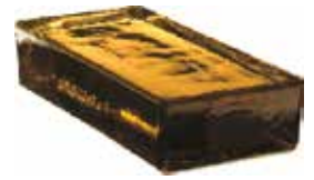
SIENA VETROPIENO RETTANGOLARE SAP CODE: 703510