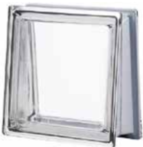
NEUTRO Q30 TRAPEZOIDAL T MET SAP CODE: 122809