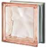
ROSA Q19 O MET SAP CODE: 123791

Available while stocks last. / Disponibles jusqu'à épuisement des stocks. / Verfügbar solange der Vorrat reicht. / Disponibles hasta agotar existencias.