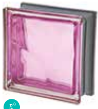
MALVA Q19 O MET SAP CODE: 120847