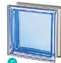
ZAFFIRO Q19 T MET SAP CODE: 113042

*Verify the availability. / Vérifiez la disponibilité. / Verfügbarkeit und minimale Produktionsmenge. / Verificar la disponibilidad.