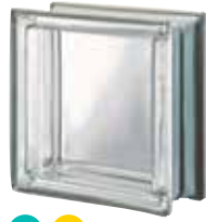
NEUTRO Q19 T MET SAP CODE: 120300