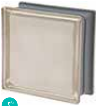
BIANCO Q19 O MET SAP CODE: 120812