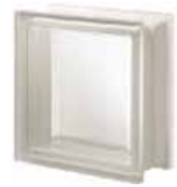
NEUTRO Q19 T SAHARA 1S SAP CODE: 124101