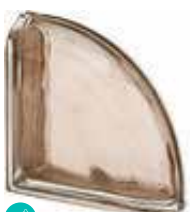
TORTORA TER CURVO O MET SAP CODE: 120837