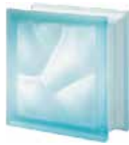
ACQUAMARINA Q19 0 SAHARA 2S SAP CODE: 124047