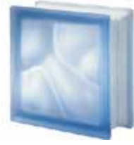
BLU Q19 O SAT SAP CODE: 123574