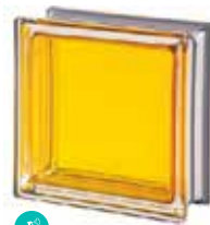
TOPAZIO Q19 T MET SAP CODE: 113038