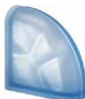
BLU TER CURVO O SAHARA 2S SAP CODE: 123783