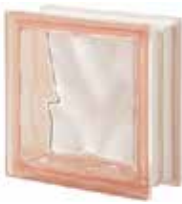
ROSA Q19 O SAP CODE: 123474