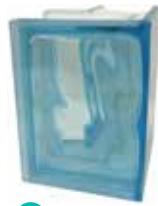
ACQUAMARINA Q19 0 CORNER 90° SAP CODE: 123924