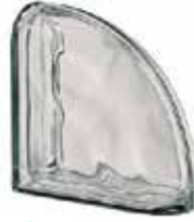
NORDICA TER CURVO O MET SAP CODE: 123794