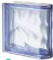
BLU TER LINEARE O MET SAP CODE: 123491