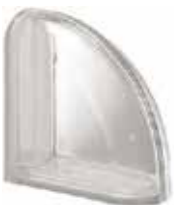
NEUTRO TER CURVO T SAP CODE: 119942