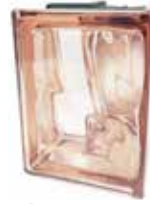
ROSA Q19 O MET CORNER 90 SAP CODE: 123801