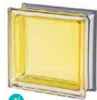
CITRINO Q19 T MET SAP CODE: 113033