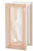
ROSA R09 O SAP CODE: 123723