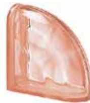
ROSA TER CURVO O SAP CODE: 123834