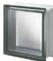
NORDICA Q19 T SAT 1 LATO SAP CODE: 121534