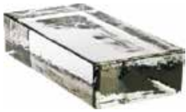
NEUTRO VETROPIENO RETTANGOLARE SAP CODE: 703410