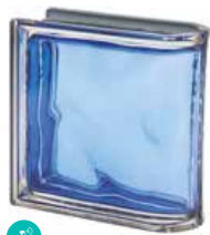
COBALTO TER LINEARE O MET SAP CODE: 120830