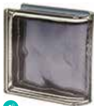
ARDESIA TER LINEARE O MET SAP CODE: 120822