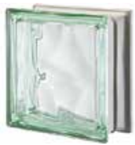
VERDE Q19 O MET SAP CODE: 123792