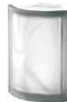
NORDICA ANG O SAT SAP CODE: 121793