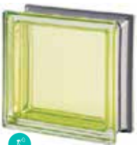
BERILLO Q19 T MET SAP CODE: 113030