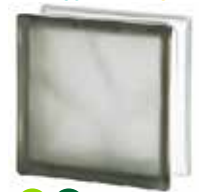
GREY 1919/8 WAVE SAHARA 2S* SAP CODE: 122181