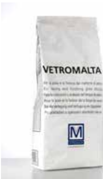
Glass mortar "Vetromalta" White or grey premixed mortar / Vetromalta Il s'agit d'un liant prémélangé de couleur blanche ou grise / Vetromalta Vorgemischter Mörtel in den Farben Weiß oder Grau / Vetromalta Es un mortero premezclado de color blanco o gris