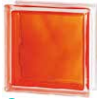
BRILLY ORANGE 1919/8 WAVE SAP CODE: 122187