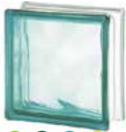
TURQUOISE 1919/8 WAVE SAP CODE: 122174