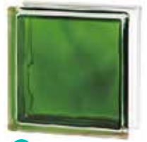
BRILLY EMERALD 1919/8 WAVE SAP CODE: 122186