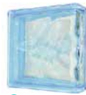
AZUR LINEAR END 1919/8 WAVE SAP CODE: 116661