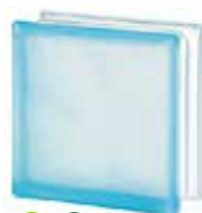
AZUR 1919/8 WAVE SAHARA 2S* SAP CODE: 122177