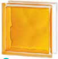
BRILLY YELLOW 1919/8 WAVE SAP CODE: 122192