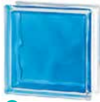
BRILLY BLUE 1919/8 WAVE SAP CODE: 122184