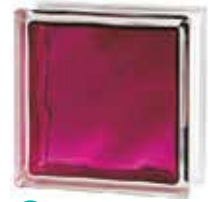
BRILLY RUBY 1919/8 WAVE SAP CODE: 122189