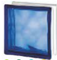
BLUE 1919/8 WAVE SAP CODE: 122170