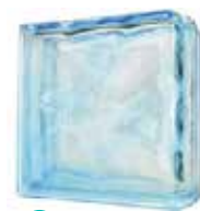
AZUR DOUBLE END 1919/8 WAVE SAP CODE: 116665