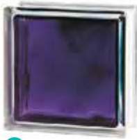
BRILLY VIOLET 1919/8 WAVE SAP CODE: 122191