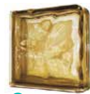
BROWN DOUBLE END 1919/8 WAVE SAP CODE: 116667