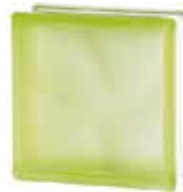
GREEN 1919/8 WAVE SAHARA 2S* SAP CODE: 122180