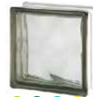
GREY 1919/8 WAVE SAP CODE: 122172