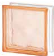
PINK 1919/8 WAVE SAP CODE: 124124