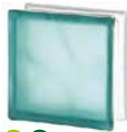
TURQUOISE 1919/8 WAVE SAHARA 2S* SAP CODE: 122183