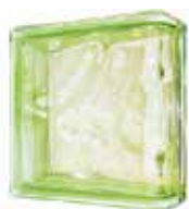
GREEN LINEAR END 1919/8 WAVE SAP CODE: 116662