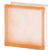
PINK 1919/8 WAVE SAHARA 2S* SAP CODE: 124152