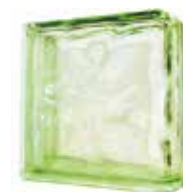
GREEN DOUBLE END 1919/8 WAVE SAP CODE: 116666