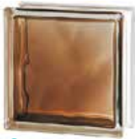
BRILLY BRONZE 1919/8 WAVE SAP CODE: 122185