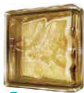
BROWN LINEAR END 1919/8 WAVE SAP CODE: 116663