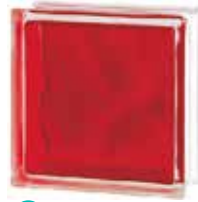
BRILLY RED 1919/8 WAVE SAP CODE: 122188