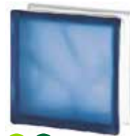
BLUE 1919/8 WAVE SAHARA 2S* SAP CODE: 122178