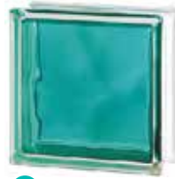
BRILLY TURQUOISE 1919/8 WAVE SAP CODE: 122190