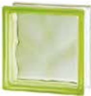
GREEN 1919/8 WAVE SAP CODE: 122140