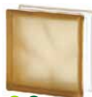
BROWN 1919/8 WAVE SAHARA 2S* SAP CODE: 122179