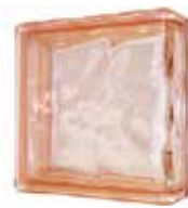
PINK LINEAR END 1919/8 WAVE SAP CODE: 124183

*Sahara 1 side (sandblasted) available on demand; minimum order 360 pcs. / Sahara 1 face (sablée) disponible sur demande; commande minimum 360 pièces. / Sahara 1 Seite (sandgestrahlt) auf Anfrage erhältlich; Mindestbestellmenge 360 Stk. / Sahara 1 lado (satinado a la arena) disponible bajo pedido; pedido mínimo de 360 piezas.