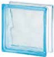
AZUR 1919/8 WAVE SAP CODE: 122169