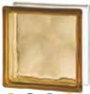
BROWN 1919/8 WAVE SAP CODE: 122171